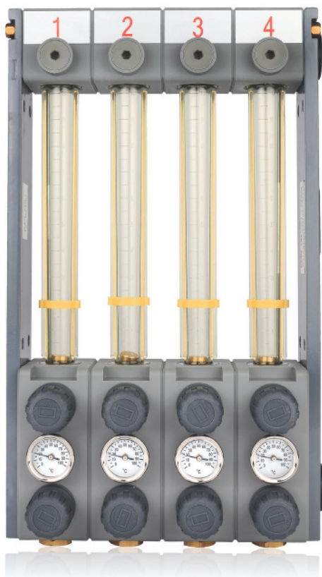
Débit-mètre FR4Z / Durchflussmesser FR4Z

Pour le Refroidissement des Moules. Débits mètres pour visualiser et réguler le débit au travers de vos outillages.